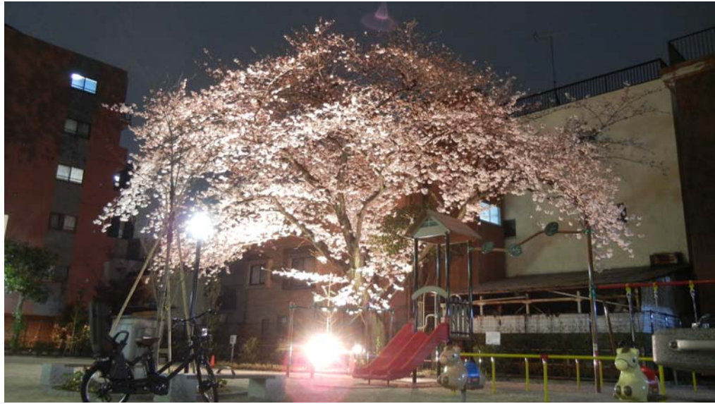
4月5日安兵衛公園にて

3月21日(火)～4月15日(土)の間、安兵衛公園、及び大横川川岸の桜のライトアップが行われました。3月は気温が低く花の開きが遅かった事もあり、当初4月8日までの予定を1週間延ばしたものです。4月に入り陽気も暖かくなった事で例年通り美しいライトアップとなりました。また、今年は安兵衛公園の花壇に、昨年秋に植えた花が咲きそよい春の香りを楽しませてくれました。