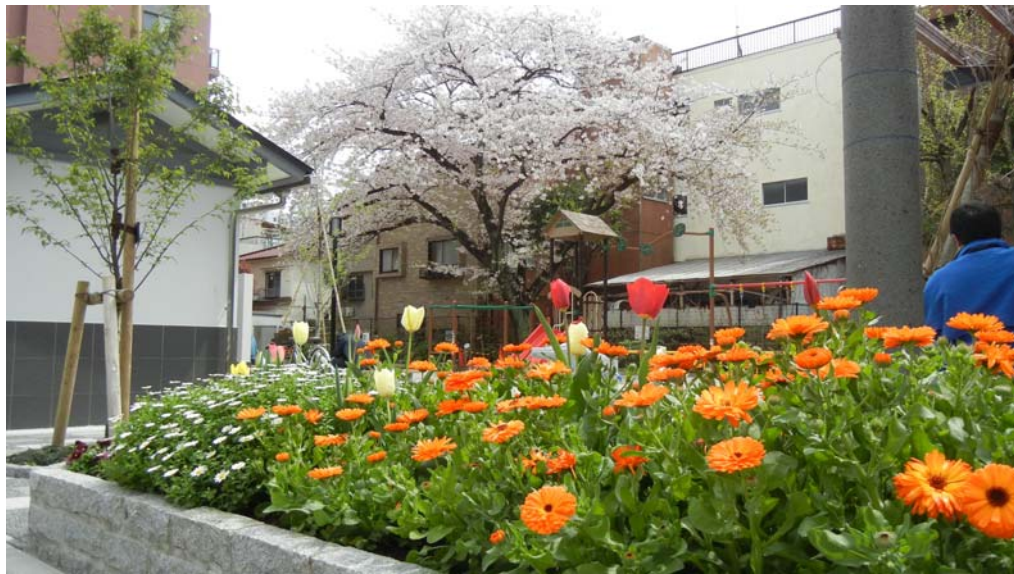
安兵衛公園の花壇と桜