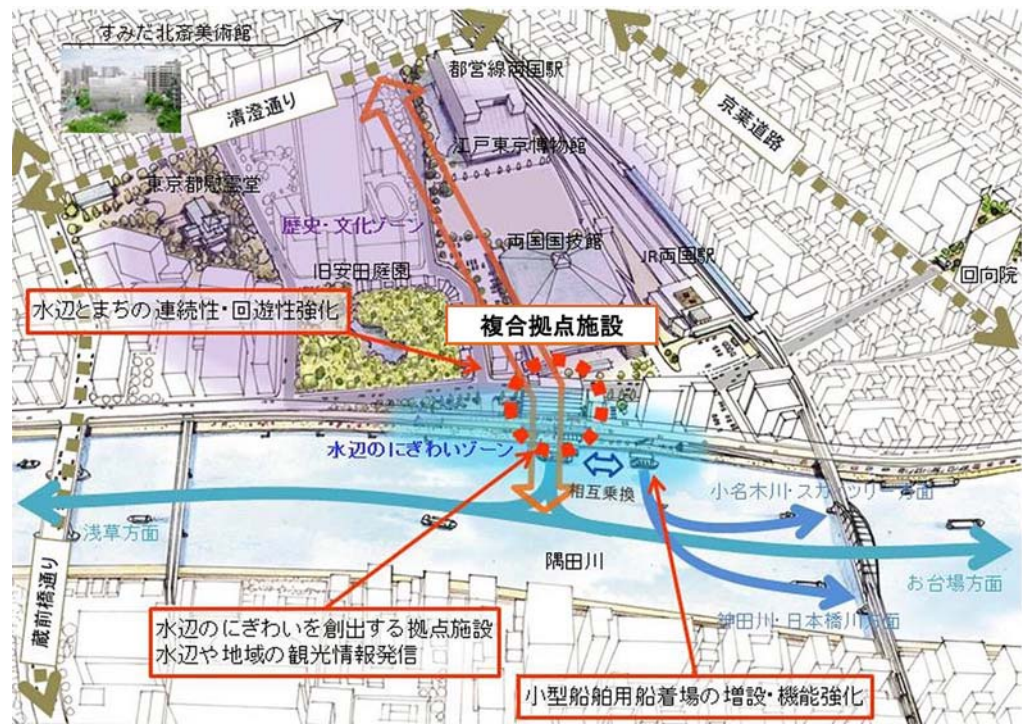
両国エリアにおける事業対象敷地の効果的活用の方向性